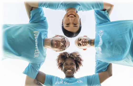
Organisaties voor sociale werking (social profit)