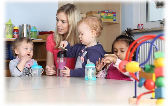
Sociale bijstand en gezondheidszorg