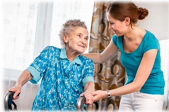
Thuishulp en -zorg