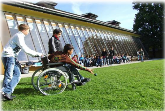
Onderwijs- en huisvestingsinstellingen en - diensten